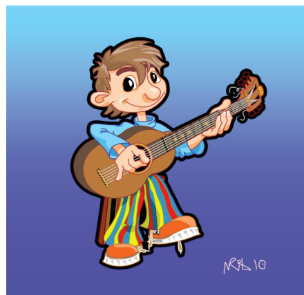
Exemplo 3. Ilustração para cartaz do CNI - Segurança do Trabalho Autor : Conselho Nacional da Indústria