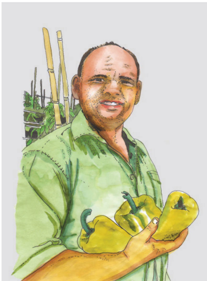
Exemplo 2. Ilustração para o livro Plano Safra Autor : Ministério do Desenvolvimento Agrário

Software: Photoshop CS5, InDesign CS5, Illustrator CS5