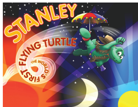
Exemplo 4. Ilustração para livro infantil Stanley, The World's First Flying Turtle Autor : Lillian Senecoff Reynolds